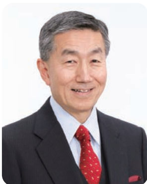
聖マリアンナ医科大学 学長

大学病院を中心とした実習、講義などには学習に適した工夫に満ちており、高次医療から高齢者医療まで幅広い看護の領域に触れることができます。これからも益々看護職の職域は広がりますが、きちんとした基礎を身に付けるには最適の環境と言えるでしょう。皆様のご入学を心よりお待ちしております。