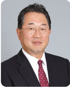
聖マリアンナ医科大学 理事長