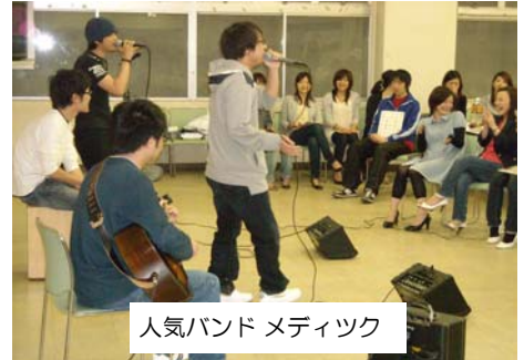
人気バンド メディック