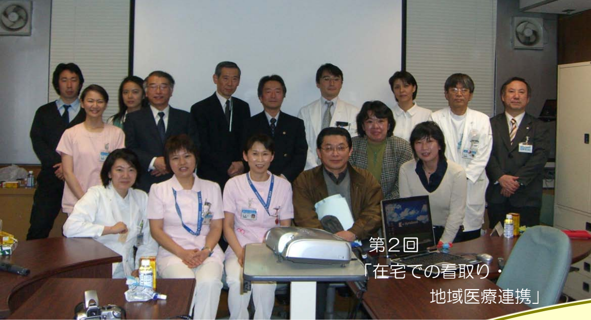
第2回 「在宅での看取り・ 地域医療連携」