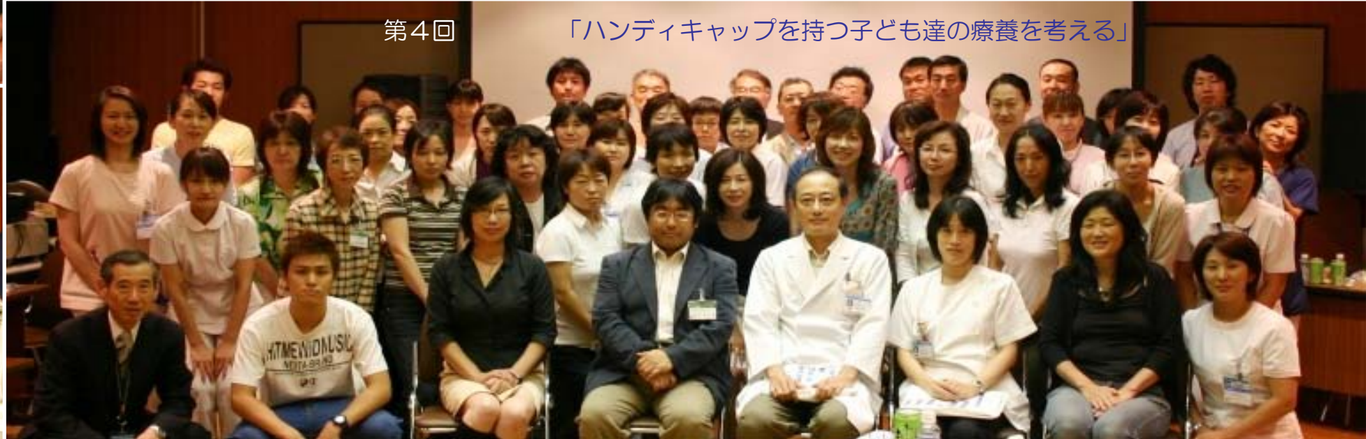
第4回 「ハンディキャップを持つ子ども達の療養を考える」