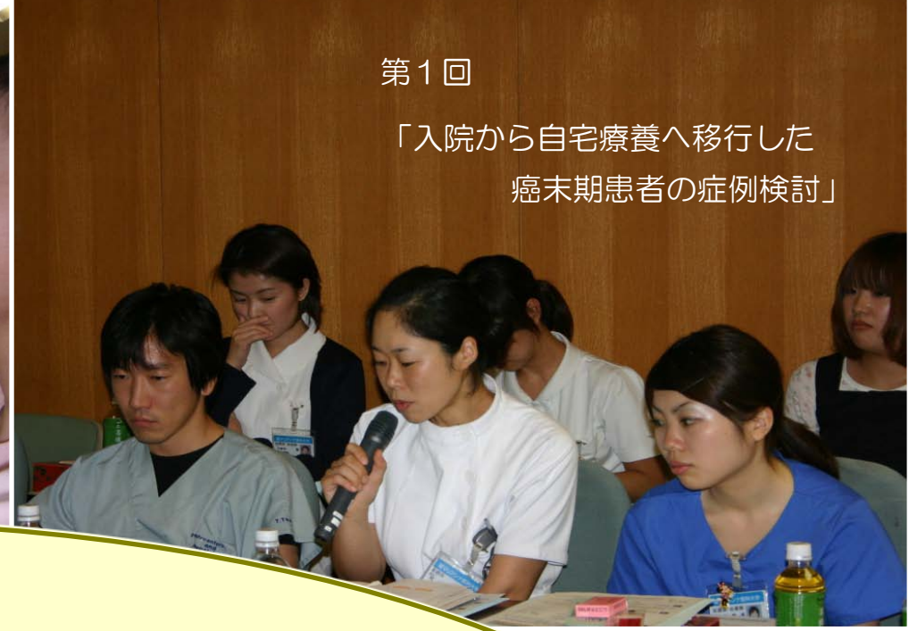
第1回 「入院から自宅療養へ移行した 癌末期患者の症例検討」